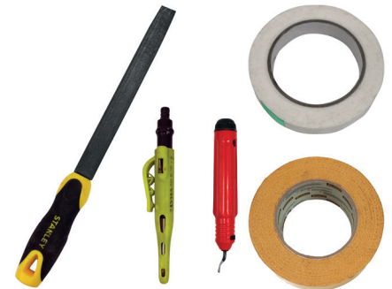
Lime, ébavureur, crayon de marquage, ruban adhésif et double face