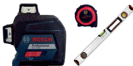
Niveau laser ou niveau à bulle Mètre ruban