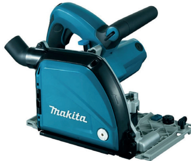
Fraiseuse MAKITA CA5000XJ