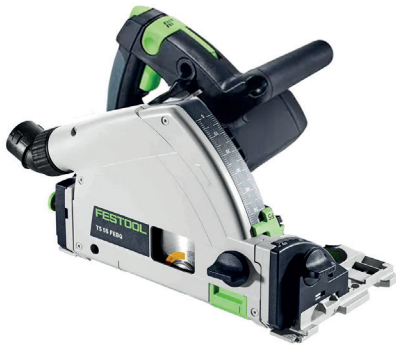
Scie FESTOOL TS 55 REBQ Plus (ref. 561551)