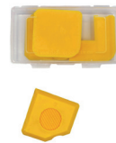
Cales de lissage