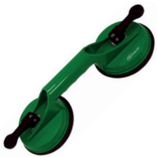
Ventouse à panneaux