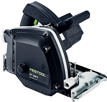
Fraiseuse FESTOOL PF 1200 E-plus Dibond (ref. 574 322)