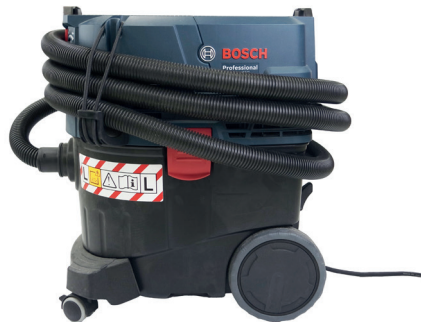
Aspirateur de chantier compatible avec les outils de coupe