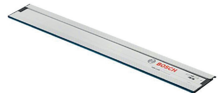
Rail de guidage FSN 1600 (ref. 1.600.Z00.00F)