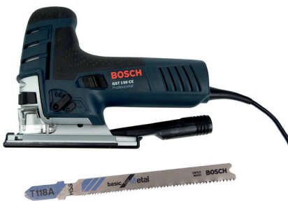
Scie sauteuse avec lame pour aluminium