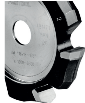
Fraise à rainurer en V HW 118x18-135° /Alu pour fraiseuse de plaque PF 1200 (ref. 491471)