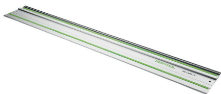
Rail de guidage FS 1400/2 (ref. 491498)