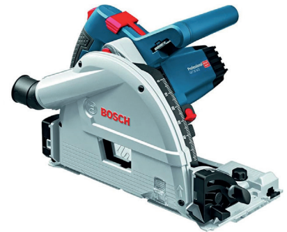
Scie BOSCH GKT 55 GCE (ref. 0.601.675.001)