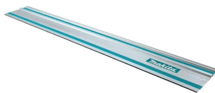
Rail de guidage 1400 (ref. 194368-5)