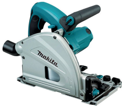
Scie MAKITA SP6000J