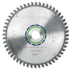
Lame HW 160x 2,2 x 20 Z52 TF (ref. 496 306)