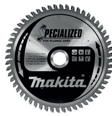
Lame carbure forme TCG spécialisée aluminium, pour scies plongantes (ref B-09307)